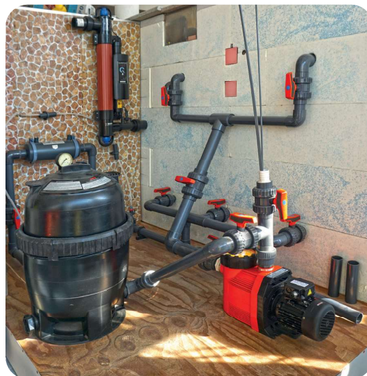
Filter mit Pumpe und Verrohrung

Alle Abwässer der Badwasseraufbereitung wie Spül- und Reinigungswässer (inklusive der Filterrückspülwässer) sind in einen Mischwasser- oder Schmutzwasserkanal abzuleiten.